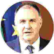
EMANUELE ORSINI Presidente di Confindustria