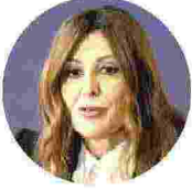
DANIELA SANTANCHÈ Ministro del Turismo